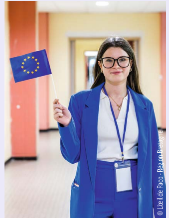
© L'Atelier Peco - Région Bretagne